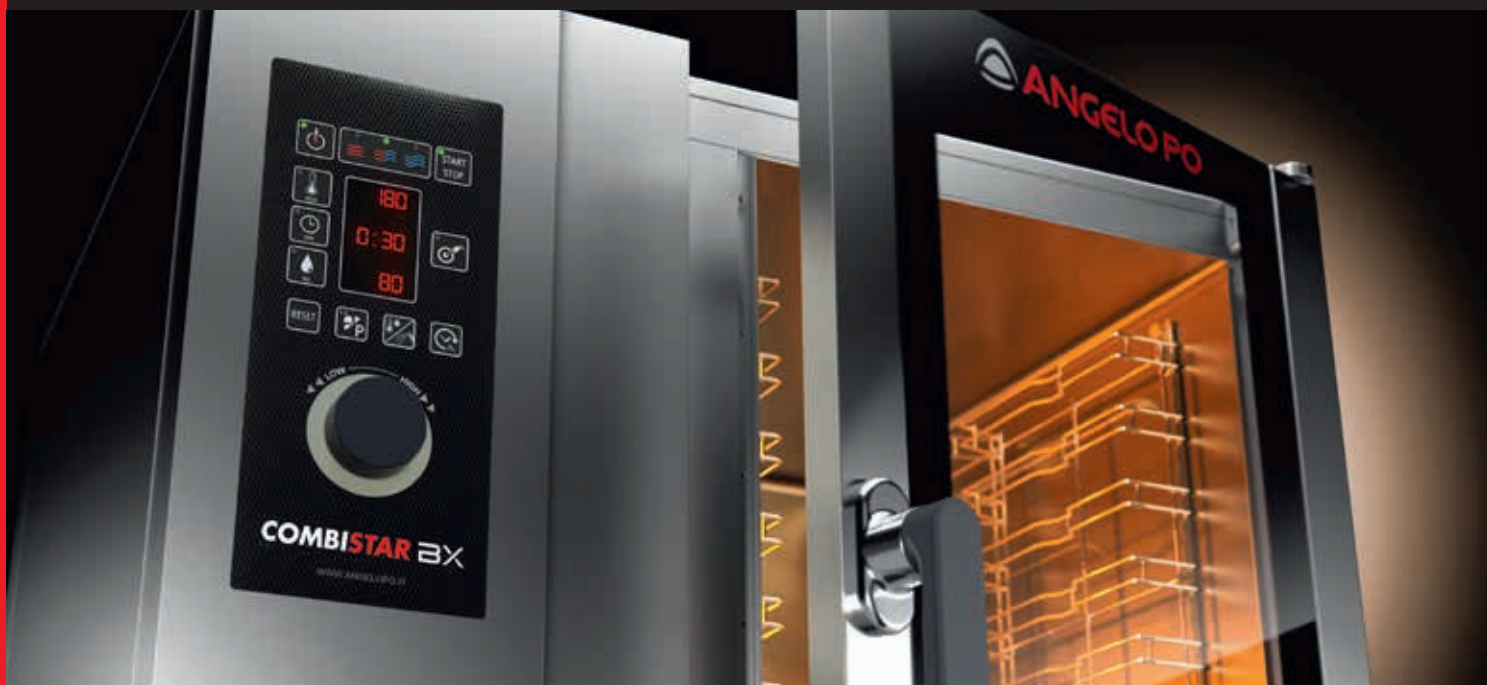
Multifunkcionalna kombinovana pećnica KONVEKTOMATI SERIJE BX